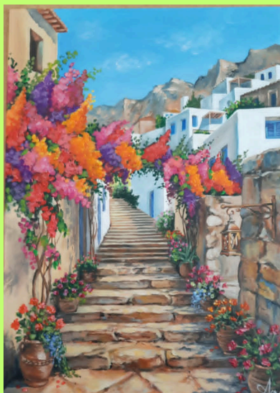
Prace Amelii Szymańskiej