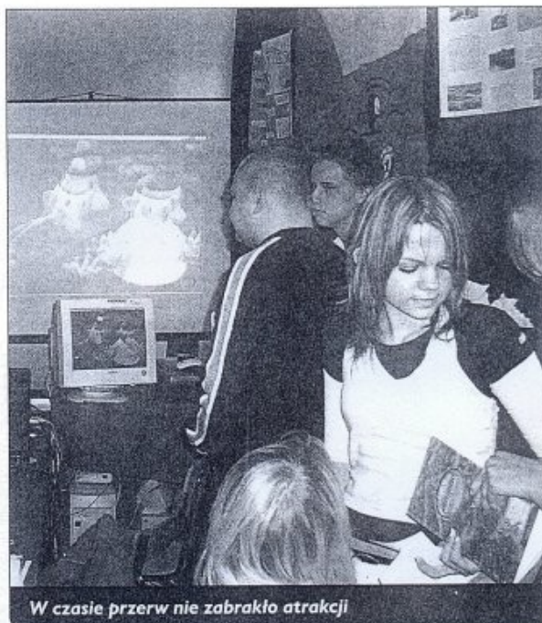
W czasie przerw nie zabrakło atrakcji

Ostatni obchodzony Dzień Narodowy poświęcony był Litwie. Organizatorzy tak przemyśleli jego obchody, by nie dezorganizować pracy szkoły, a jednocześnie dać uczniom możliwość wzięcia w nim udziału. Młodzież podczas każdej z przerw mogła uczestniczyć w różnych kon-